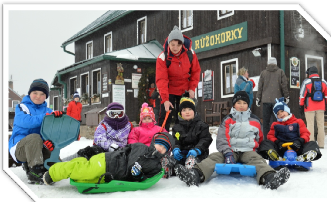
Dětská část výpravy na Růžohorky

Co by to bylo za zimu, kdybychom nejeli na hory. První setkání se sněhem nám zajistilo zimní soustředění v termínu od 25. 1. do 1. 2. Letos jsme jeli do již osvědčeného pensionu U Lanovky ve Velké Úpě. Největší obavy ještě několik dní před odjezdem způsobovaly sněhové podmínky a počasí. Zřejmě jsme si ale nějak zasloužili změnu, neboť počasí se nad námi smilovalo. Udeřily mrazy a některé dny dokonce sněžilo. Celý týden poskytovaly sjezdovky i běžecské stopy dostatek sněhu. Letošní výlet nevedl pouze přes hřebeny na vrchol Sněžky, ale cestou přes Pec pod Sněžkou, odkud jsme rádi vyzkoušeli novou lanovou dráhu na Růžovou horu. Na "Růžohorkách" došlo i na tradiční kyselo a borůvkové knedlíky. Celý týden zpříjemňovaly večery nad společenskými hrami a zpívání s naší horskou kapelou. Celý týden se povedl na jedničku a pevně věříme, že počasí letos dovolí ještě alespoň jednodenní návštěvu hor.