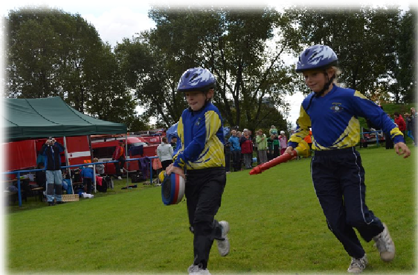
Zápis provedla Veronika Schwarzová

Dne 21. 9. 2013 jsme pořádali ve Zličíně závody. Mladší a starší kategorie běhali štafety dvojic a požární útoky neboli Zličínský dvojboj. Mladších družstev se zúčastnilo 12 z ostatních sborů + naše příprava a 11 starších družstev. Ze Zličína startovali dvě družstva mladších + příprava a jedno družstvo starších. Starší se umístili na 7. místě, příprava 1. místo a mladší obsadili 1 a 9 místo. Závody se povedly, počasí nám přálo, nepršelo a všem se moc líbilo. Děkujeme všem fanouškům, a těšíme se na další ročník.